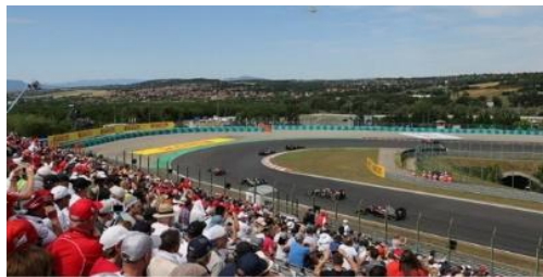
Visión desde nuestras localidades

ENTRADA F1 INCLUIDA EN PRECIO PARA LAS 3 JORNADAS. SECCIÓN TURN 1 (Curva 1 final de recta de Salida/Llegada)