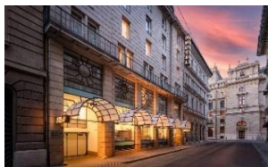
Budapest. Révay u. 24. 1065 Hungría

16.15h- Check in en K+K Hotel Opera Budapest (o similar). Un buen hotel y sobre todo estratégicamente magníficamente situado para múltiples visitas. Incluimos el desayuno dentro del precio final. Las rooms serán dobles con dos camas para poder alojar desde individuales, a dobles, triples, cuádruples. Si viajas "solo" no es obligatorio coger una habitación individual.