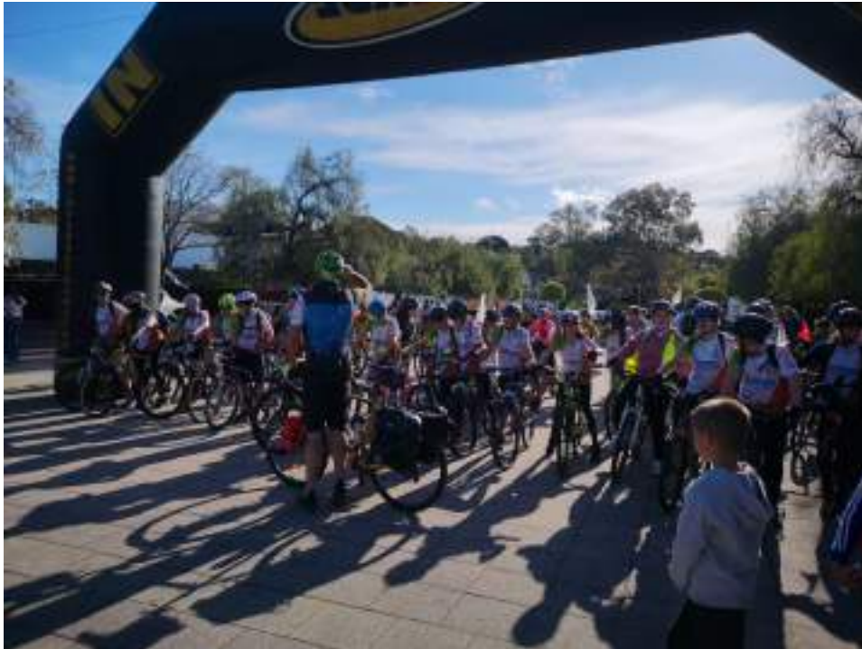
Salida de la primera etapa del reto solidario "Hoy Pedaleo por Ti 2025".

En el curso académico 2023/2024 iniciaron el proyecto "Hoy Camino Por Ti". Su objetivo era unir a pie en tan solo 3 días las 4 localidades que integran el colegio: Valdelarco, Castaño del Robledo, La Nava y Fuenteheridos. Se trata de unos 40 km que el alumnado de 1º y 2º de la Enseñanza Secundaria Obligatoria (ESO) realizó en mayo de 2024, caminando por la red de senderos del Parque Natural Sierra de Aracena y Picos de Aroche. Durante el recorrido por estos pueblos recaudaron fondos para colaborar con la Asociación Yala, que ayuda a niñas de Tánger (Marruecos), asegurando su escolarización y continuidad en la educación, especialmente a aquellas con pocos recursos. Así, la meta del proyecto es garantizar que tengan acceso a la educación y a las oportunidades que merecen. Aprovecharon el pasado puente por el Día de Andalucía para viajar a Marruecos y conocer a las niñas de la Asociación Yala. Como se puede leer en la publicación realizada el 05/03/2025 en la página de Facebook del colegio: