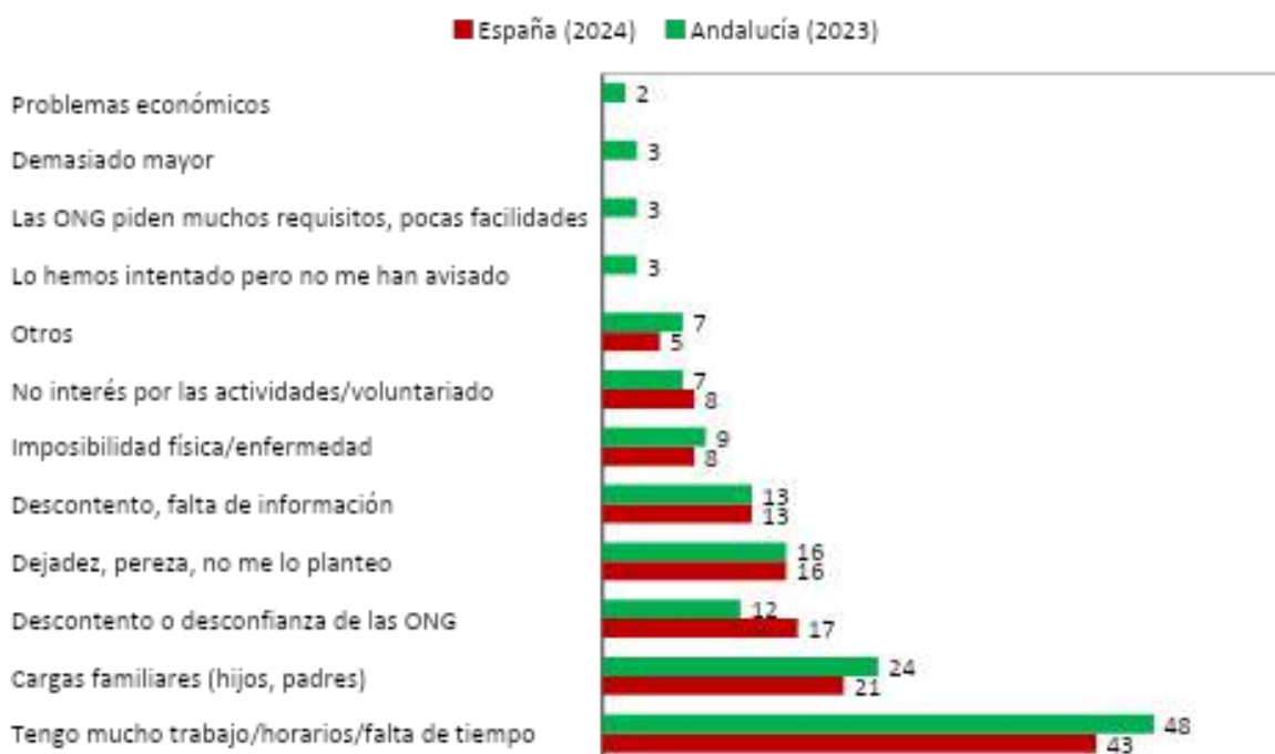
Gráfico 1 : Razones para no hacer voluntariado (%), 2024

Fuente: PVE, 2024 y 2025a. Elaboración propia.