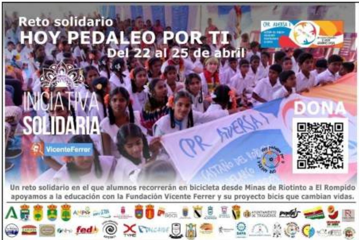
Cartel del reto solidario "Hoy Pedaleo por Ti 2025".

En el presente curso académico 2024/2025 vuelven a repetir la iniciativa. El objetivo de esta 4ª edición es apoyar de nuevo la labor de la FVF a través de su proyecto "Bicicletas que cambian vidas". En esta edición, el reto se ha celebrado del 22 al 25 de abril de 2025, recorriendo un trayecto desde Minas de Riotinto hasta El Rompido, pasando por las localidades de El Campillo, Zalamea, Valverde del Camino, Beas, Trigueros, Gibraleón, Aljaraque y El Portil. El evento busca movilizar a toda la comunidad educativa de estos municipios, recaudando fondos para facilitar el acceso a la educación de escolares de Anantapur, en la India, a través de la entrega de bicicletas. Con ellas podrán desplazarse "con mayor facilidad, rapidez y seguridad" a sus escuelas y "evitarán que muchos de ellos, especialmente niñas, abandonen sus estudios de forma prematura". Así, las personas participantes pedalean "por mejorar la vida de sus compañeros de la India rural" y "por un mundo más justo y con mayores oportunidades para todos". Cualquier persona podía unirse al reto a través de la web y colaborar económicamente.